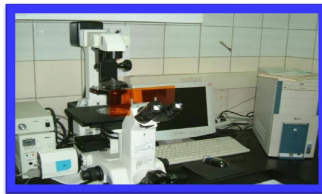
倒立螢光顯微鏡含數位影像系統